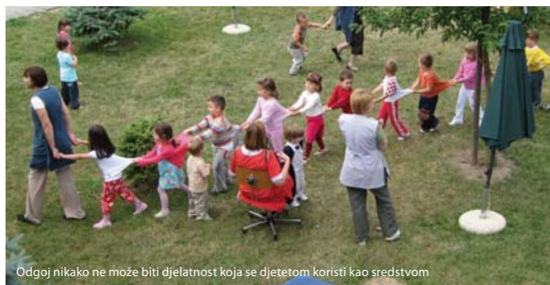
Odgovj nikako ne može biti djelatnost koja se djetetom koristi kao sredstvom

Proturječno je, međutim, reći da 'učitelj ne može sjediti u razredu jer nije kreativan i samostalan ', ako on istodobno mora ostvarivati propisani mu program bez mogućnosti suodlučivanja ili (kakve li strahote!) samoupravnog sudjelovanja u njegovom oblikovanju. Kakvu se to kreativnost i samostalnost može očekivati od onih koji u svakom trenutku moraju znati i voditi računa o tome tko ih plaća (hrani) i što on od njih očekuje. Jer čak i da mogu i da mu žele 'stvaralački ugoditi', kako mogu znati da neće promašiti. A ako to ne mogu znati, nije li za njih bolje da i ne pokušavaju.